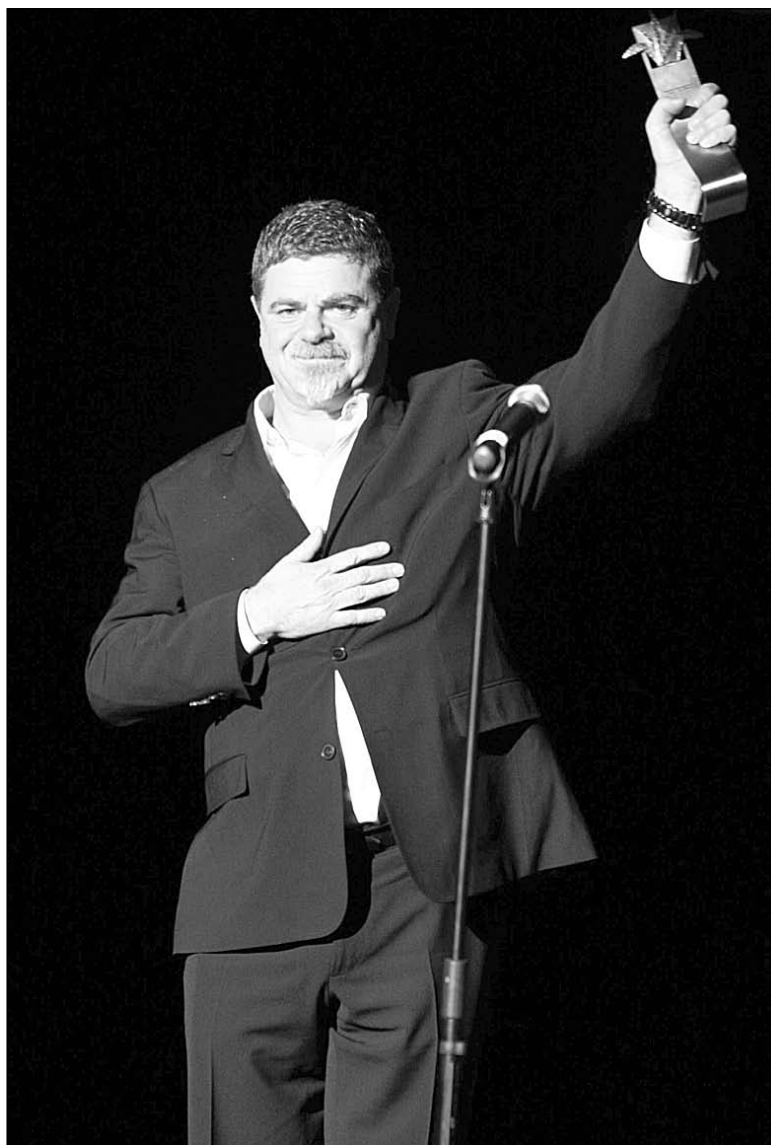
▲ Gustavo Santaolalla levanta su Premio Guadalajara en la gala que inauguró el festival de cine.

En el marco de la inauguración hubo un homenaje, a través de una proyección, a la obra del comediante mexicano Germán Valdés Tin Tán.