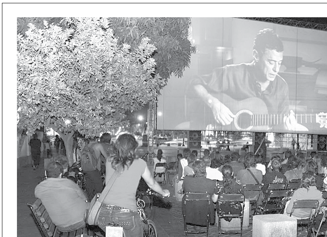
Función en la rambla Cataluña.