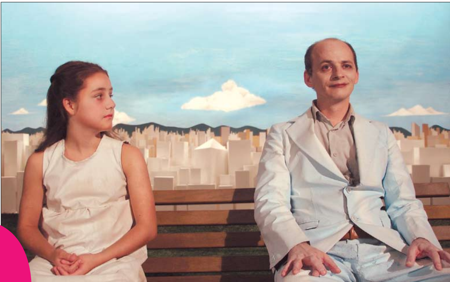
▲ Escena del cortometraje brasileño Antonio Pode.